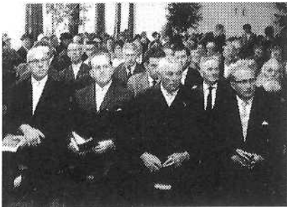
Einweihung des Patrich-Gemeindehauses 1963