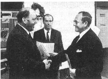
Der damalige bayerische Innenminister Bruno Merk überreicht 1970 Döbler die Siegerurkunde für „Bürger, es geht um deine Gemeinde“